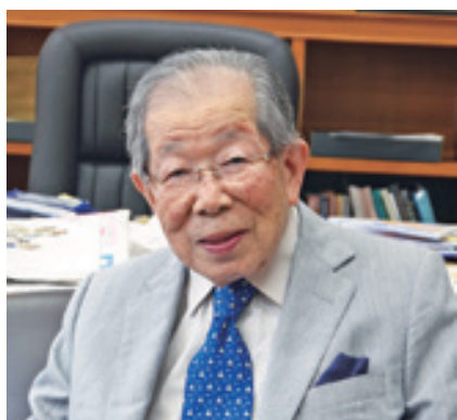
日野原重明先生 2017年7月18日ご逝去 105歳

私が日野原重明先生に初めてお会いしたのは、昭和から平成に年号が変わる数年前のことでした。それ以前は日本の音楽療法界はまだ一つにまとまっておらず、様々なところで、音楽療法の萌芽の実践が行われていました。その一つが、日野原先生が立ち上げた「日本バイオミュージック学会」です。そしてもう一つが、山梨の日下部病院長松井紀和先生が主宰されていた「音楽療法セミナー」でした。